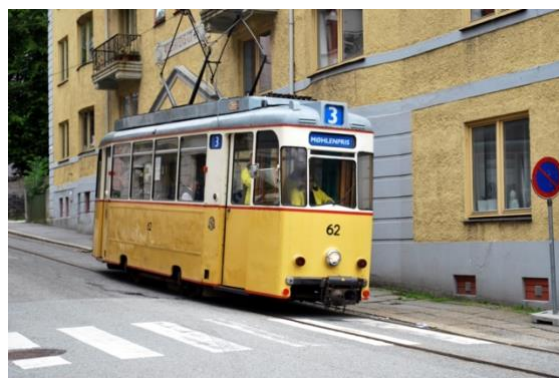
Veterantrikken på Møhlenpris.