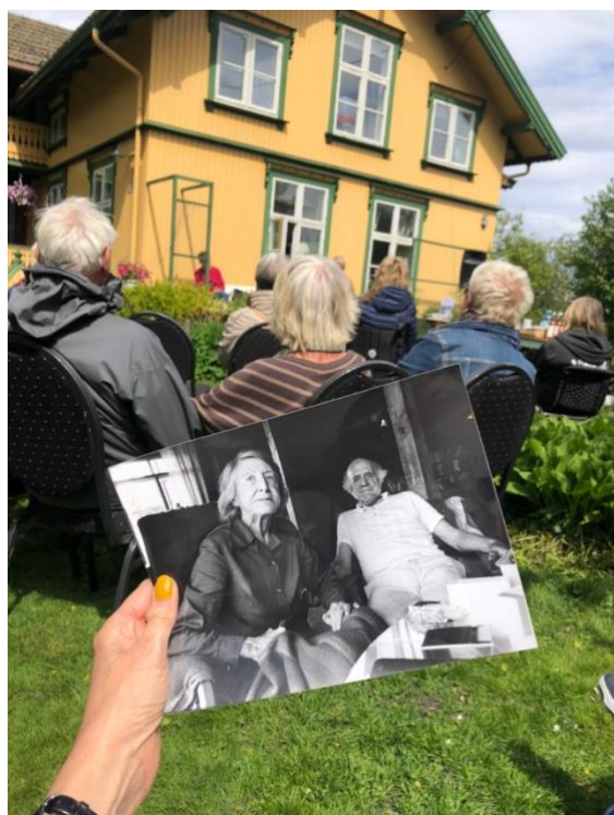
Nedreaas-dagen på Nesodden

28. mai inviterte Nesodden biblioteks venner (sammen med selskapet) til hagefest på Slottet, som Nedreaas' hus på Nesodden ble kalt på lokalt folkemunne. Dette er et arrangement det har vært jobbet med lenge, og vi er fornøyde med at det ble gjennomført og ble en suksess.