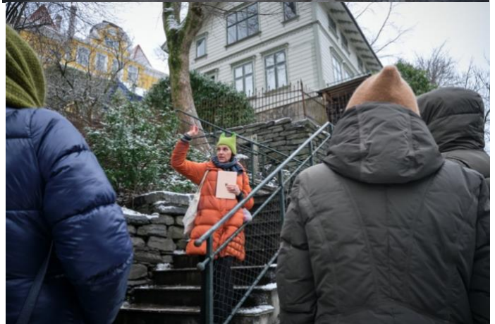
Byvandring under LitFestBergen

Årsmøtet til selskapet gikk av stabelen midt i mars. Denne gangen, dessverre, med litt dårlig deltakelse. Det har fått oss til å tenke at vi kanskje må arrangere årsmøtet som en liten, raskt gjennomført del av et litt mer publikumsvennlig